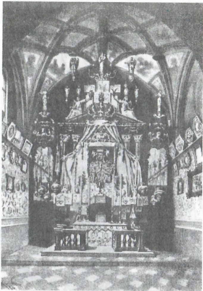
Плененная Ченстоховская икона Матери Божией в каплице Ясногорского латинского монастыря. Литография конца XIX века.